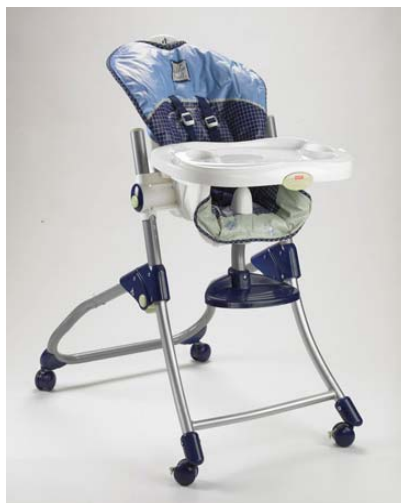
Chaise haute Close to Me

Localisez la référence de votre produit située sur le sticker blanc apposé sur le dossier du siège. Merci d'utiliser les images ci-dessous pour localiser la référence de votre produit.