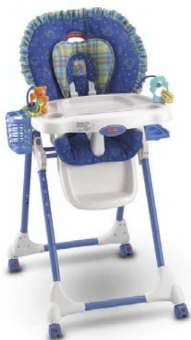
Chaise haute Link-a-doos

Exemples de photos des chaises hautes Link-a-doos, Close-to-me ( les couleurs, formes et accessoires varient selon les chaises)